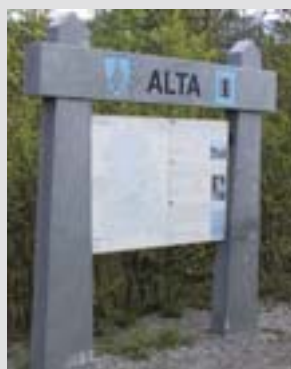
Infoskiltet er utført i materialer og farger tilpasset det omkringliggende miljøet.