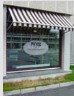
Markisen er godt tilpasset bygget, og reklamen er plassert på vinduet i stedet for på markisen.