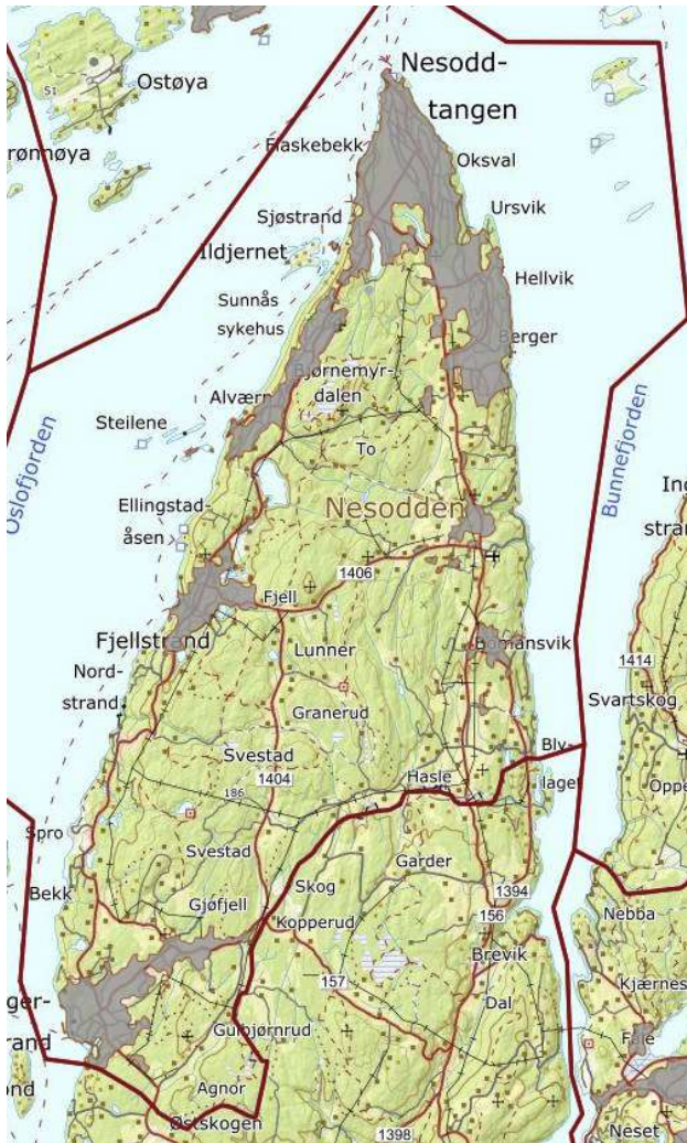
Figur 1 Nesodden kommune, grå felt er tettsteder, Kart SSB

brann- og redningsvesenets behov for slokkevann, jf. forskrift 17. desember 2015 nr. 1710 om brannforebygging § 21.