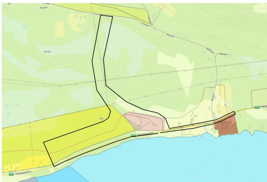
Figur 2: Utsnitt fra gjeldene kommuneplanens arealdel og planområdet.

Gjeldene plan for området er kommuneplanens arealdel (planID 2011001), vedtatt 24.06.2011. Planområdet er avsatt til boligområde, LNF, adkomstvei, framtidig sykkelvei og annet byggeområde. Foreslått boligområde er i tråd med gjeldene plan. Tursti og gang- og sykkelvei samsvarer delvis med gjeldene plan.