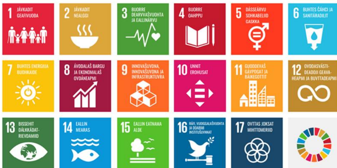
FNs bærekraftsmål på samisk. Kilde/oversettelse: Sametinget.

som gir bærekraft. Som kommune og innbyggere i et særdeles rikt land, kan vi ta andre hensyn enn egne økonomiske fordeler. Vi bryr oss også om naturen, og om hvordan alle mennesker i alle land egentlig har det.