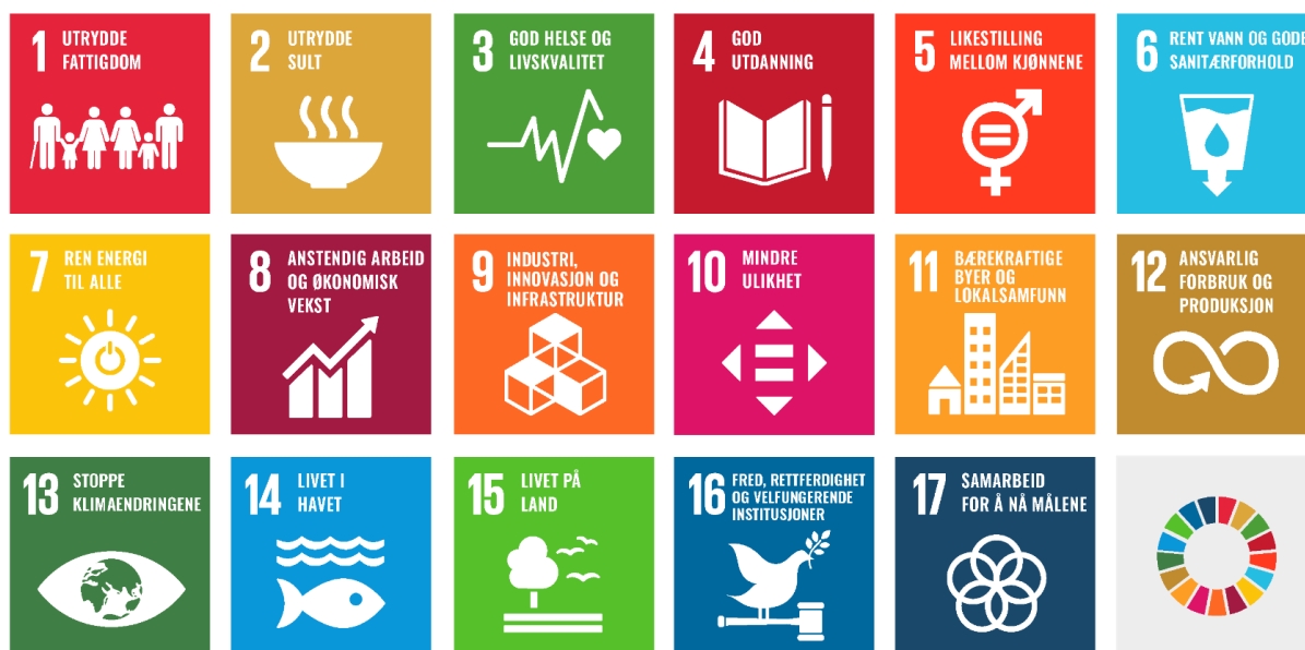
FNs bærekraftsmål.

bli mer attraktive som bo- og næringskommune. Samfunnsdelen er tilpasset statlige og regionale planer, samt FNs bærekraftsmål. For første gang; kommunestyret i Nesseby kommune har vedtatt en plan for hvordan vi kan bidra til at jorden blir et bedre sted – for alle.