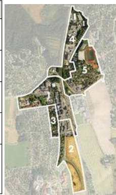
Tab 1: Områdeutnyttelsen for delområdene i planområde for områdereguleringsplan for Ås sentralområde