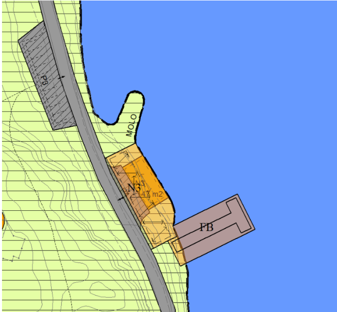
Figur 1: Nytt planforslag med utvidelse av naustområde og flytebrygge markert i lys oransje over gjeldende plan markert i oransje og grått.