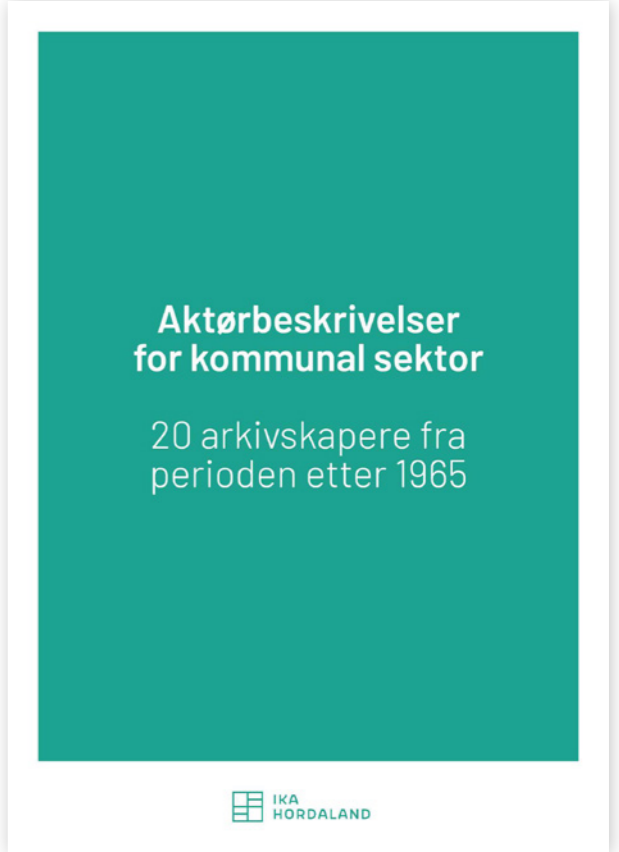
STANDARDISERING: Heftet Aktørbeskrivelser for kommunal sektor. IKA Hordaland. Layout: Daniel Gonzalez Exposito

Det ferdige resultatet ble trykt opp og distribuert til KAI-institusjonene. Tilbakemeldingene på prosjektet har vært svært positive, og mange har uttrykt at de selv ønsker ta i bruk beskrivelsene på Arkivportalen. Dette viser både et ønske og et behov for en standardisering av aktørbeskrivelser for kommunal sektor.