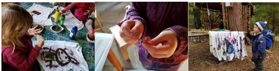
Skaperglede og kreativitet

Ei oppdaget at våtservietten hun tørket seg av på, hadde så fine farger sammen og brukte den til å trykke på genseren. Noen ønsket seg «hår» og sydde selv på garn. Kan jeg få bruke nål, det har jeg aldri gjort før. Da ble det som Pippi så fint har lært oss: Det har jeg ikke gjort før så det klarer jeg helt sikkert og garn ble festet på. Noen brukte ark som «sjablong» og noen ville ha glitter. Noen ville ha alt. Noen malte øyne og ansikt rett på genseren sin, mens andre malte kroppen til dyret. Det var prosessen som var viktig, og ikke nødvendigvis at det ble helt likt dyret man hadde valgt. Farger? «Det er jo de samiske fargene «var det noen som sa da de så malingen. Det å blande farger og finne frem til akkurat den brunfargen «min rev «skal ha, ja, det var morsomt. For på veien til å få «sin farge», ja, da var en innom mange morsomme farger i kategorien brun 😊 Hvordan får vi oransje? Går det an å få rosa når vi har rød, men ikke hvit? Ja, vi fant ut av mye med farger vi. Karnevalet ble en festdag sammen med Elger på Solplassen. Det var lett å se at kostymene gjorde oss stolte « Den er egentlig mamma sin, jeg synes den er så fin jeg ». Vi danset, vi lekte, vi lo og vi spiste pølser og godteri Selve godteriet måtte vi jobbe for å få. Det hang i et tre og alle fikk slå 1 og 2 ganger hver. Hm. det var ikke så lett, men latter og spenning ga resultat 😊