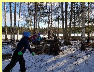
Vi fanger «reinsdyr»

Barnehagen skal synliggjøre samisk kultur og bidra til at barna kan utvikle respekt og fellesskapsfølelse for det samiske mangfoldet