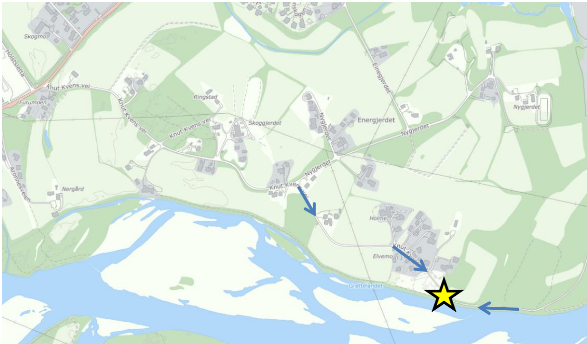
Julesprek 8: Aronnes, forbygninga i enden av Knut Kvens vei. Festet på gjerde.