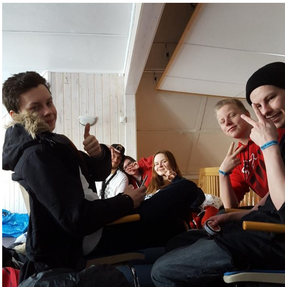
(Rusfri ungdom som gleder seg til festivalen starter)

Til tross for en 18 timers lang busstur, hold ungdommene humøret oppe med sosialisering, sang og spenning for årets festival. Ungdommene hadde tilgang til mat, drikke og sjokolade som Rockebussen Finnmark styret hadde ordnet før bussturen. Resultatet var en gjeng ungdommer som fikk omgås og bli kjent med andre ungdommer fra hele Finnmark, kose seg med god musikk og kultur, og allerede gleder seg til neste års Rock Mot Rus. Alt i alt fikk de oppleve en trygg, god og rimelig reise og ikke minst vite at de ikke trenger rus for å ha det gøy på en festival.