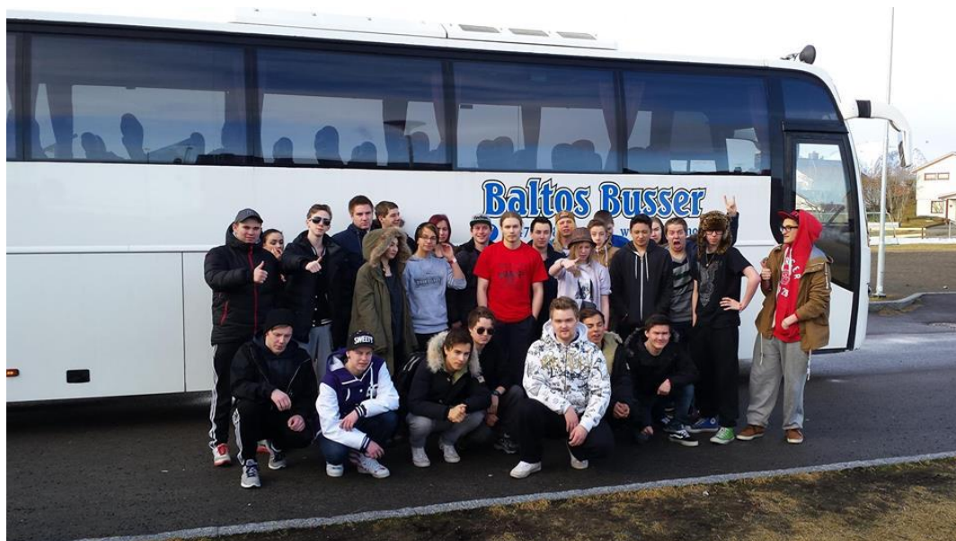
(Rockebussen Finnmark deltagere i 2014)

I 2014 klarte vi å samle inn penger ved å søke om støtte hos diverse firma, ungdomsting, kommuner, Lions, Rock Mot Rus og Rock Mot Rus Venner og leid inn buss til en 36-timers (tur/retur) lang reise med 32 musikk-glade ungdom. Resultatet var fantastisk. Vi kom tilbake fornøyd, inspirert, motivert og med troen på oss selv som rusfri ungdom i Finnmark! I 2015 fikk vi leid inn 2 busser, og 50 ungdommer fra forskjellige kommuner i Finnmark reiste ned til Andenes på Rock Mot Rus.