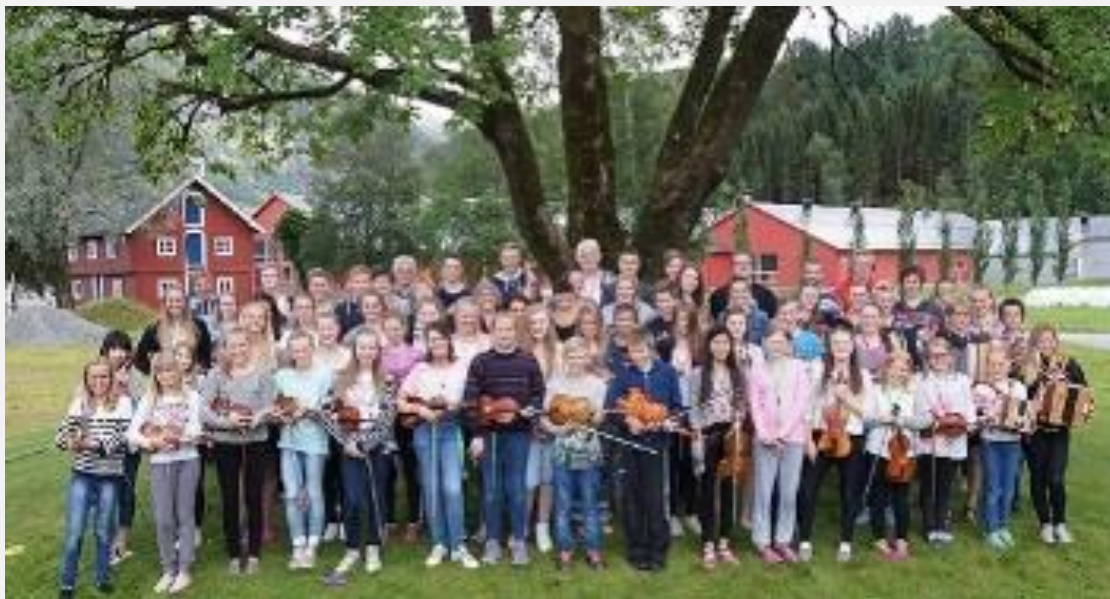
Deltakarar og instruktørar på Mokurset 2015.

Vi rettar ei stor takk til alle som støtta Mokurset 2015!