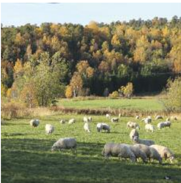
Sauer på hå-beite.

For å øke kompetansen om landbruket i Alta, arrangeres det markdag/gårdsbesøk for Altas politikere og administrasjon, minimum 1 gang pr år.