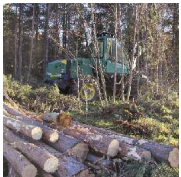
Hogstmaksin i arbeid.