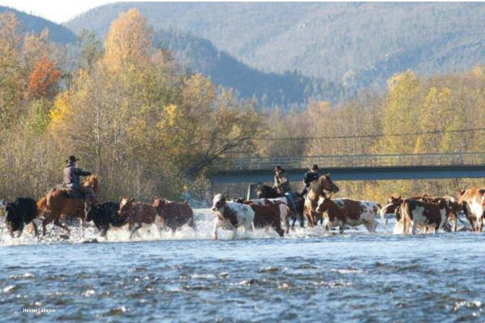
Hester i aksjon