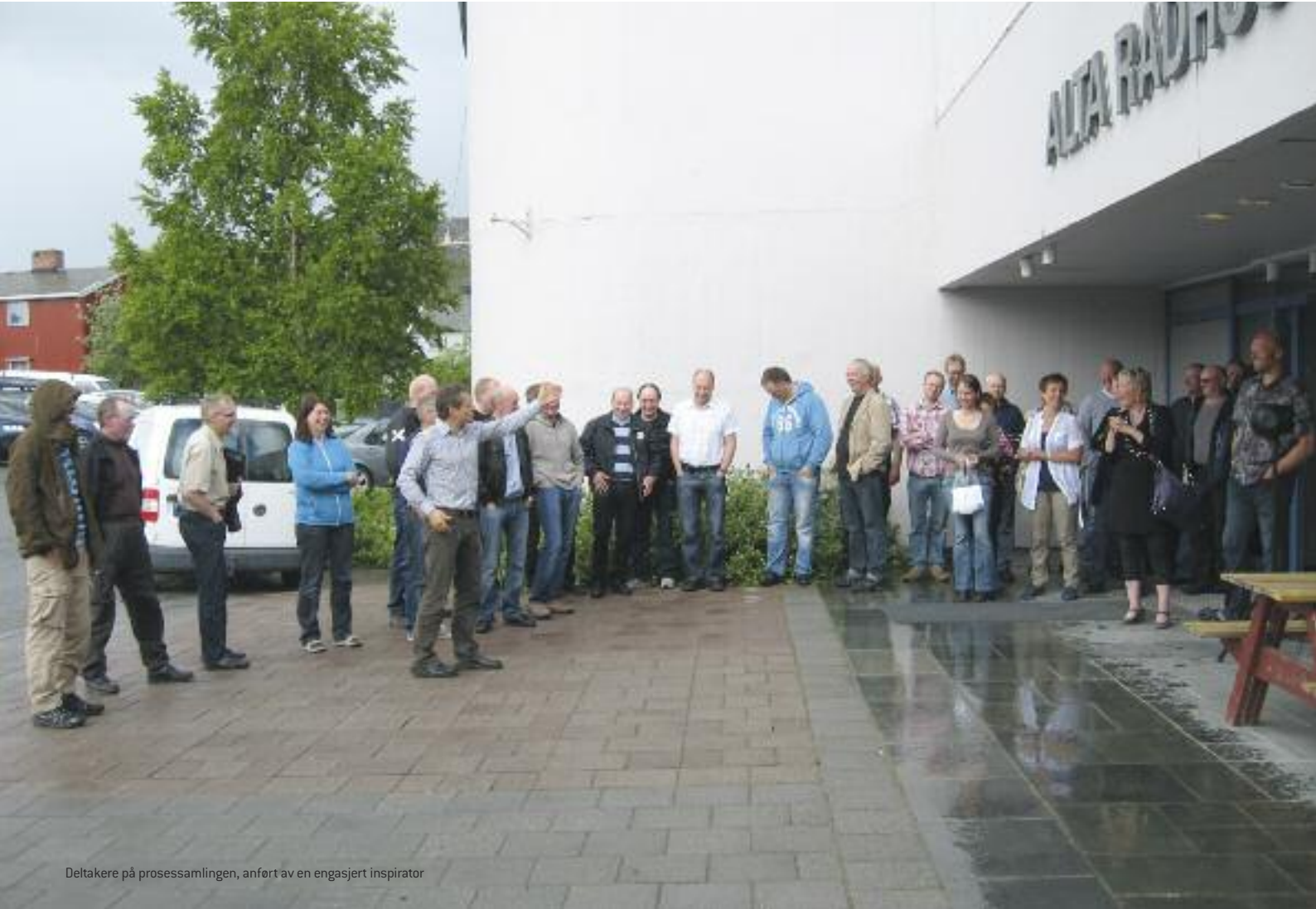
Deltakere på prosessamlingen, anført av en engasjert inspirator

Ved utarbeidelse av en ny landbruksplan ble det viktig å involvere samtlige av kommunens bønder, for å få nødvendige innspill på status og fremtidsutsikter for de enkelte bruk.