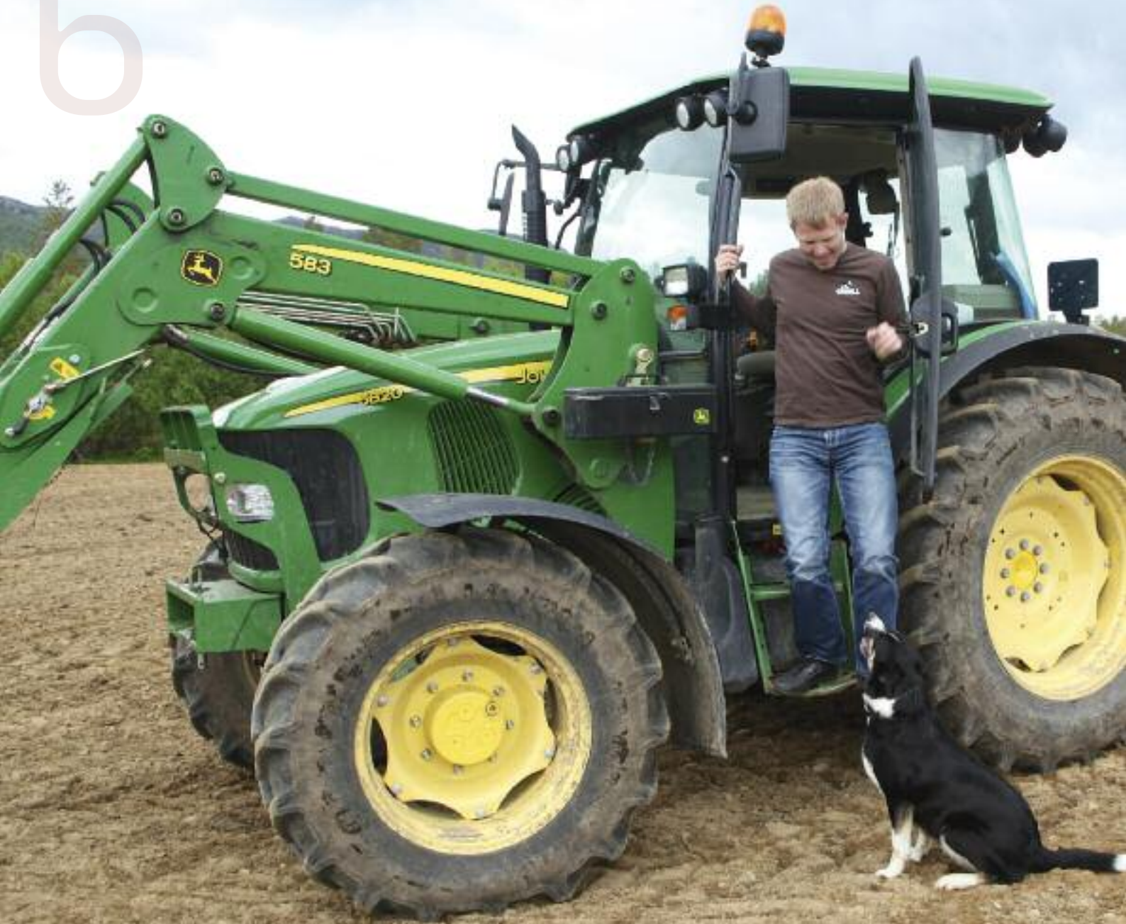
Glade unge bønder.