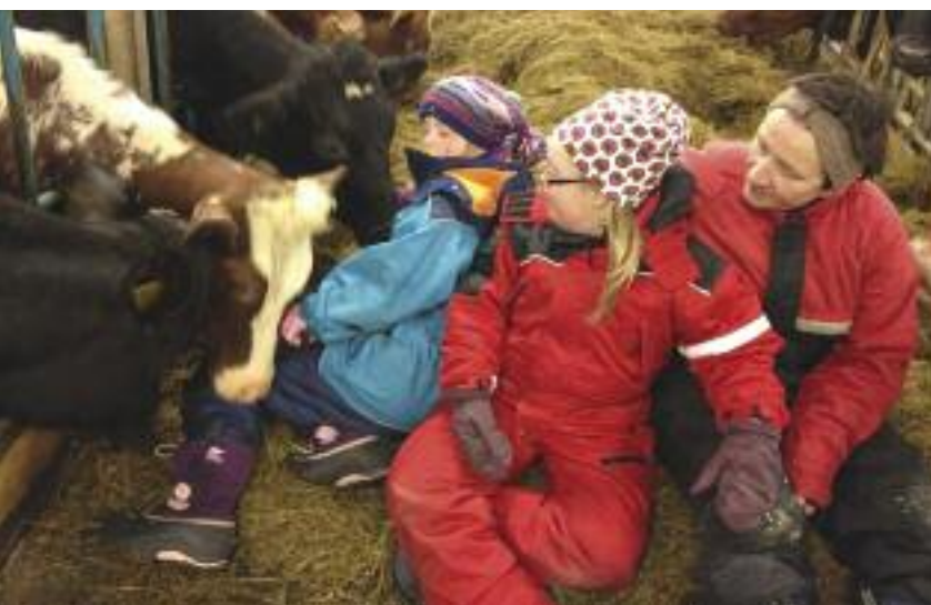
Inn på tunet