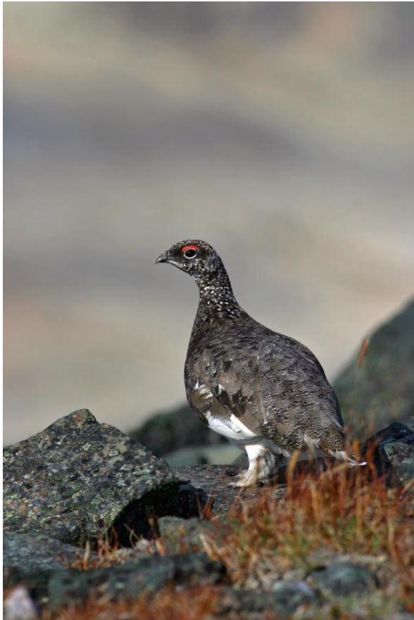
Fjellrypestegg.