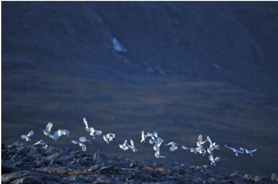
Det har blitt flere av disse i løpet av våren og sommeren i Finnmark.

Velkommen og skitt jakt på Finnmarkseiendommen!