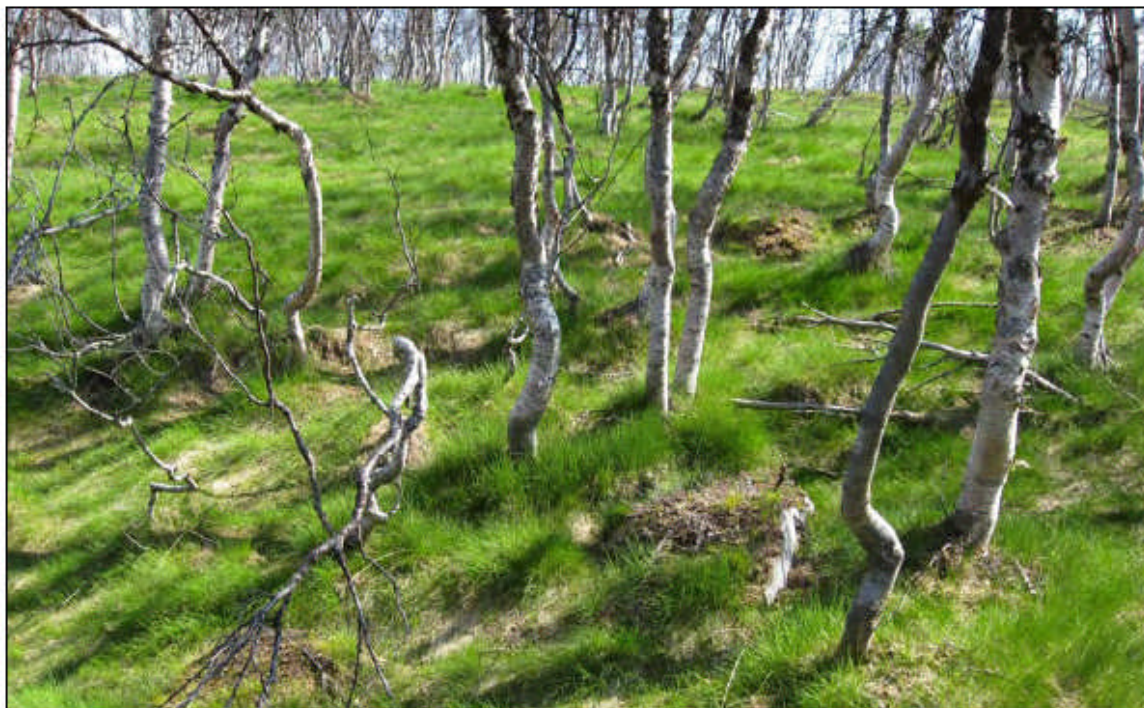
Vegetasjonen har endra seg sterkt etter flere års insektangrep. Mer og mindre sammenhengende smylematter er nå karakteristisk for blåbærbjørkeskogen i distriktet. Bildet er fra vestsida av Vuopme-Čevvelaš (MIA).