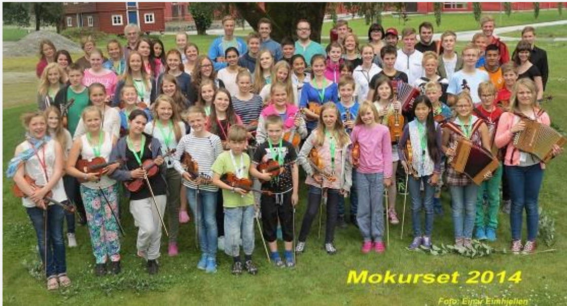
Deltakarar og instruktørar på Mokurset 2014.

Vi rettar ei stor takk til alle som støtta Mokurset 2014!