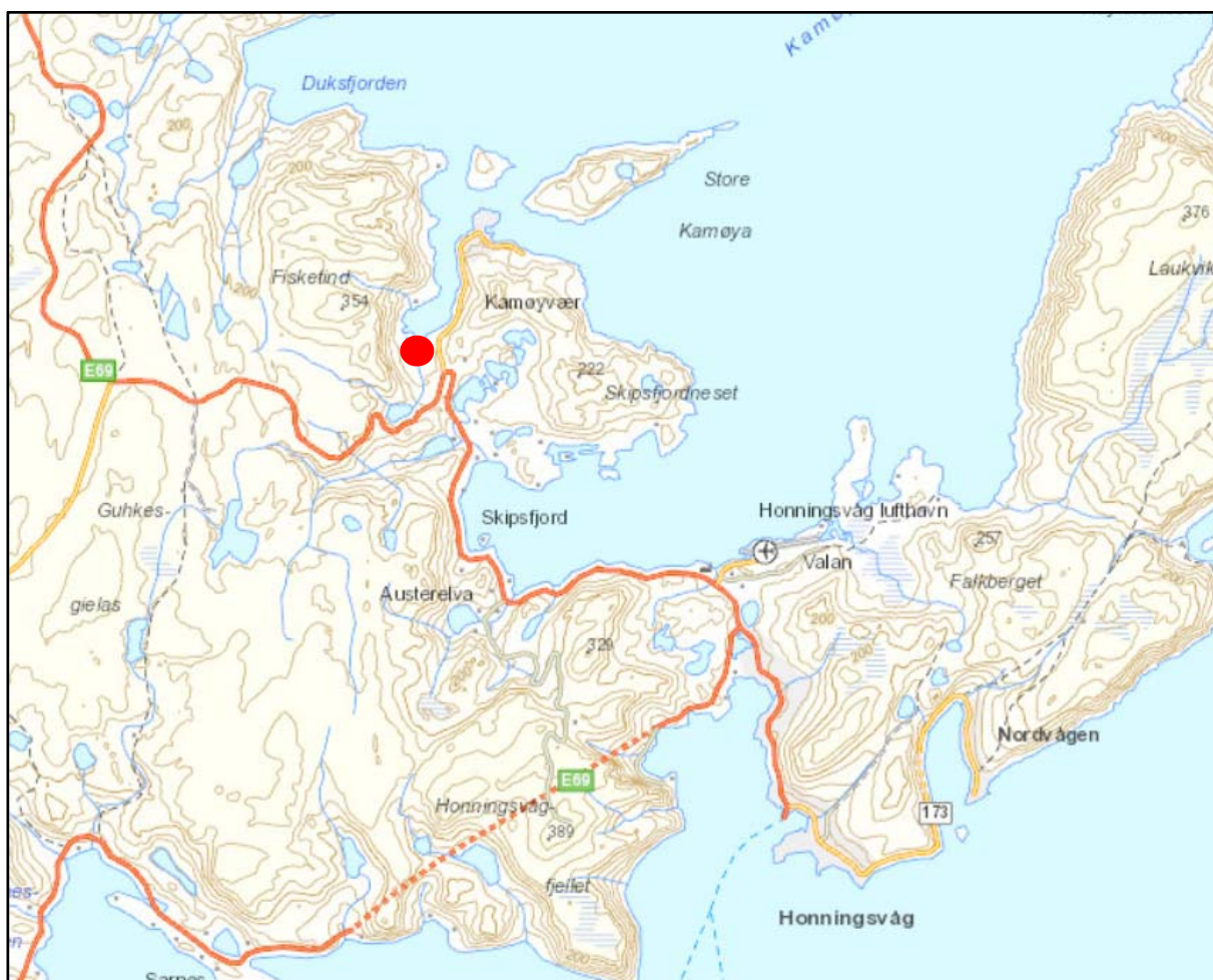
Bilde 1. Planområdets plassering ved Fv. 172, ca. 2 km. fra Kamøyvær.

Reguleringsplanen omfatter et areal på ca. 15 daa innerst i Risfjorden samt nødvendig areal for en adkomstveg ned til området. Mer detaljert avgrensning av planområdet ses av kart som er vedlagt varslingsbrevet. Gjennom planarbeidet kan arronderingen bli noe forandret før planen leveres til 1. gangs behandling. Det vil bli tilsiktet å ikke beslaglegge mer areal en nødvendig for tiltaket.