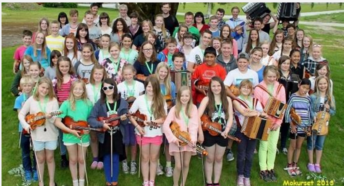
Deltakarar og instruktørar på Mokurset 2013.

Vi rettar ei stor takk til alle som støtta Mokurset 2013!