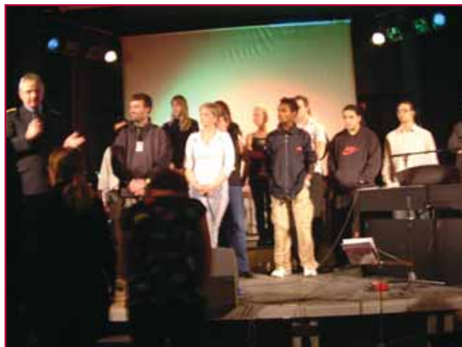
De opptredende mottok stor applaus fra fullsatt festsal i Oslo fengsel