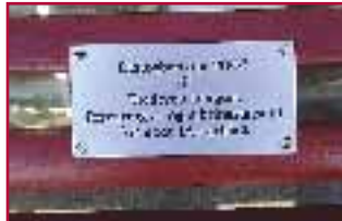
Påskriften på dialogbenken gir inspirasjon til videre arbeid med IA-avtalen.