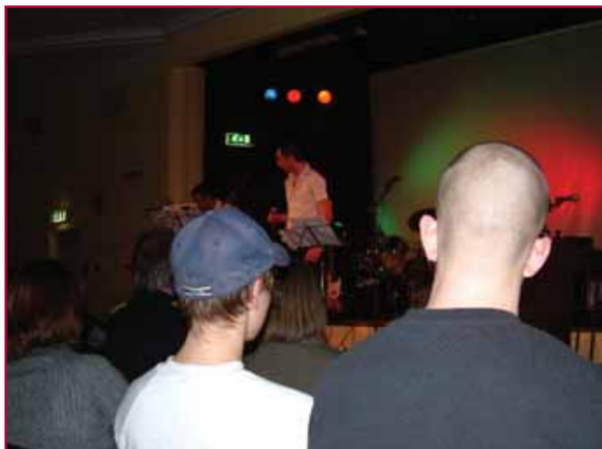
Innsatte på og foran scenen hadde en flott opplevelse

konserten i Oslo fengsel. Her fikk vi tilhørere sannelig en utvidet forståelse av hva skoletilbud til innsatte kan være og kan gjøre for elevene, og ikke minst hva elevene selv har i seg av muligheter. ●