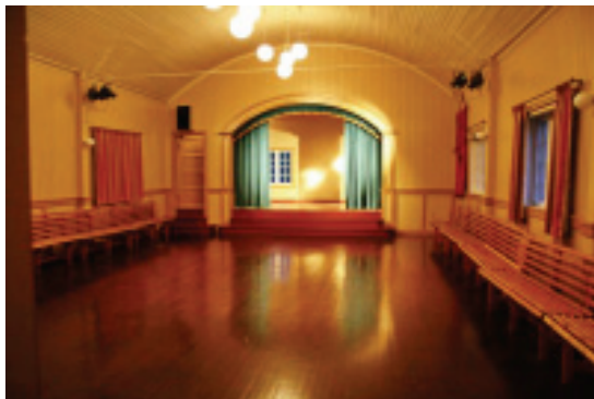
Solabusalen er tom på biletet. Det blir den ikkje når Valdreskappleiken går av stabelen den 24. mars

Det bli servering av enkle rettar på dagtid, mens middagsserveringa altså foregår på Solabu. Sal av øl, vin og brus på kvelden.