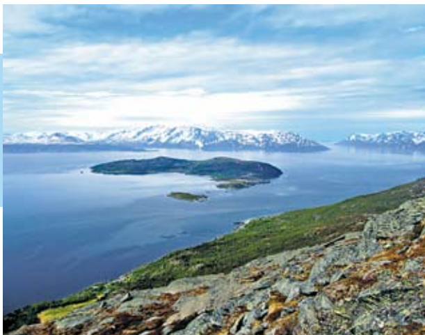
På vei til toppen Dønnevarre i Kviby

Alta kommune har en lang tradisjon med toppturer i Miljøuka. Dette tilbudet er etter hvert blitt utvidet slik at vi nå også tilbyr "Alta 10-toppers" til våre mange turgåere.