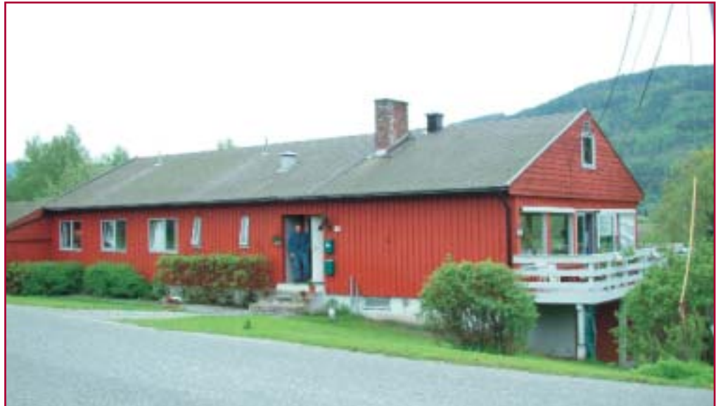
Drammen overgangsbolig ligger i et rolig villastrøk et stykke utenfor Drammen sentrum, mellom travbanen og Drammenselva, adresse Buskerudvn 195, telefon 32 82 21 17.

nale fengsel som baserer seg på inntak fra hele landet. Hovedtyngden av søknadene kommer likevel fra egen region. Vi har gode forbindelser som gir sysselsettingstilbud til de innsatte her, slik som Drammen Industri, som er en arbeidsmarkedsbedrift med mekanisk verksted og snekkerverksted. Vi bruker også Fretex. Bedriftene er veldig fornøyd med arbeidskraften som kommer herfra. Fordi de er inne i et soningsopplegg, er de stabil arbeidskraft. Skoletilbudet i Drammen er godt utbygd, og avstanden til Kongsberg og skolesentra i Vestfold gjør utdanningsmulighetene gode. Resten er i vanlige jobber. Alderen på beboerne varierer fra 20 til 67 år. I snitt er de mellom 30 til 40 år. De skal være i stand til sysselsetting og villige til å følge aktivitetskravene. Beboerne kommer ganske innpå hver-