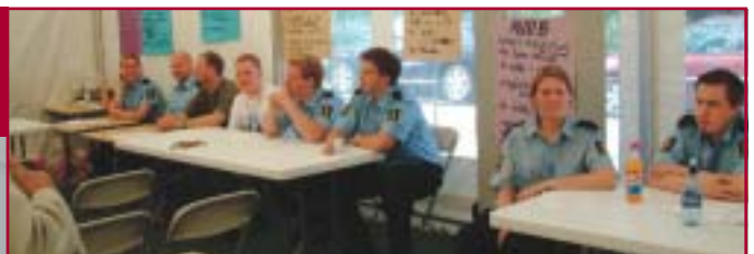
Oslo fengsel med sine ulike avdelinger