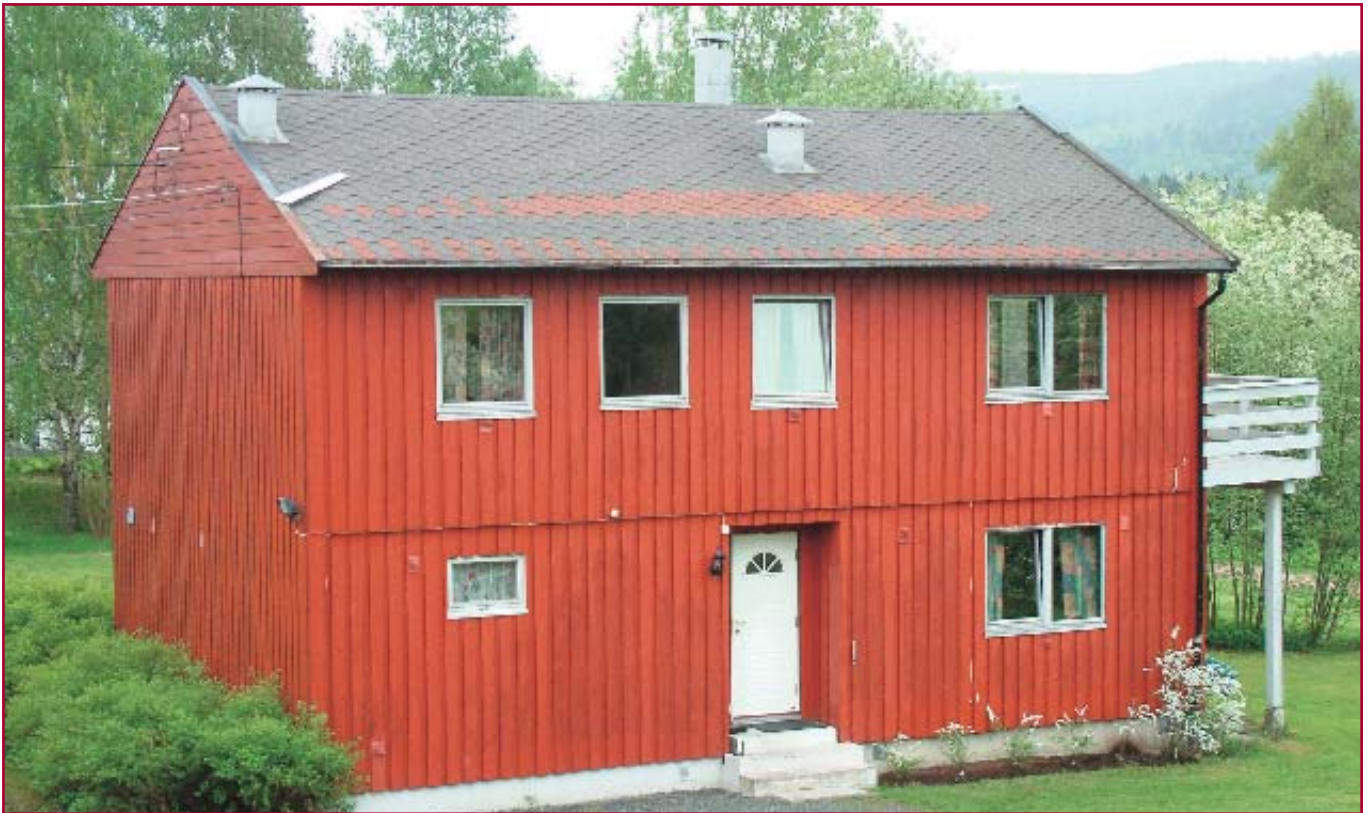
Nede i hagen ligger den gamle personalboligen som brukes til botrinn to.