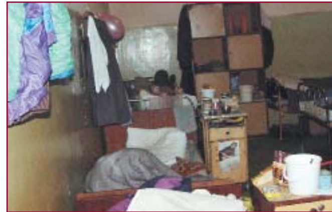
Et av rommene på fengselspsykehuset.