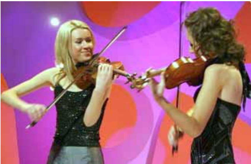
Sølvjentene frå Kjempesjansen

Nyårsfest på Herangtunet. Omtrent 70 feststemte deltakarar trør taktfast inn i det nye året.