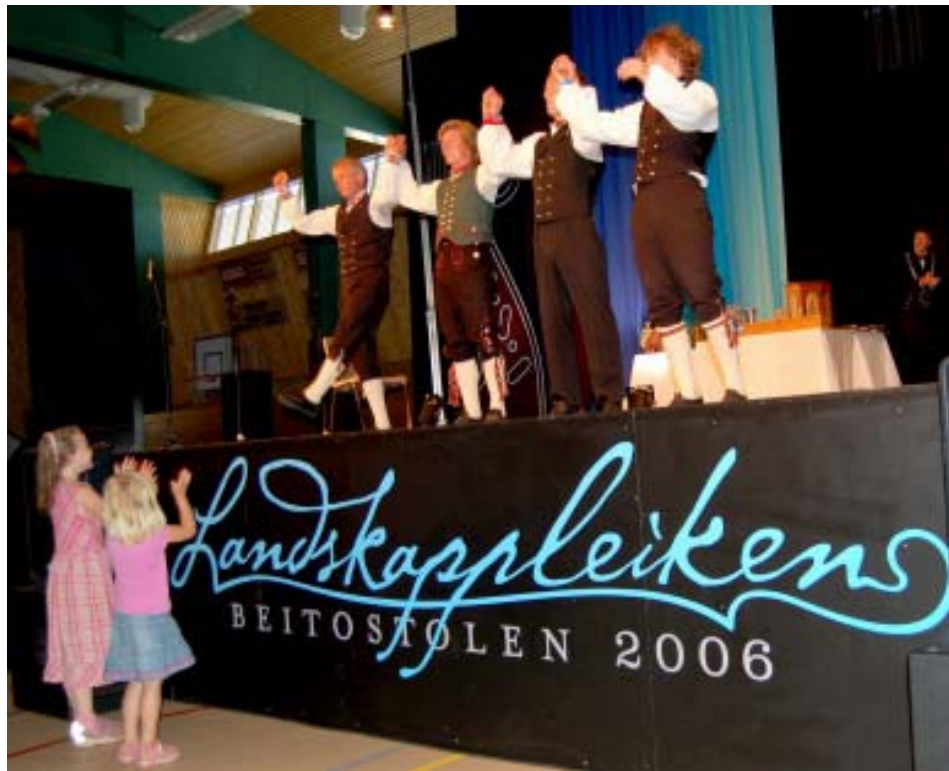
Avslutning på ein vellykka kappleik