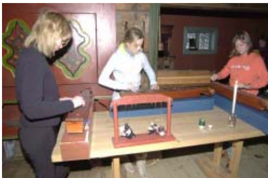
To langeleikgrupper stilte på UKM i fjor. Kvar blir det av dansarane, felespelarane og dei andre frå folkemusikkmiljøet?