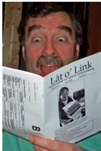
Låt o link byr på mykje folkemusikkdramatikk!