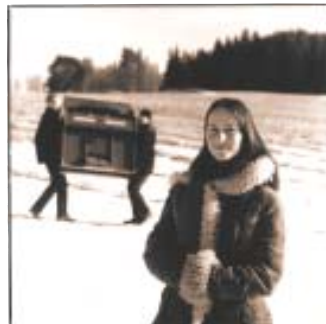
Triakel