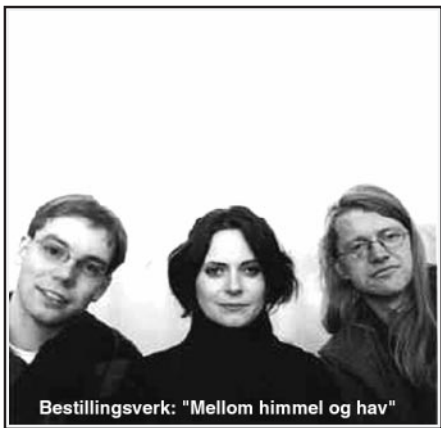
Bestillingsverk: "Mellom himmel og hav"