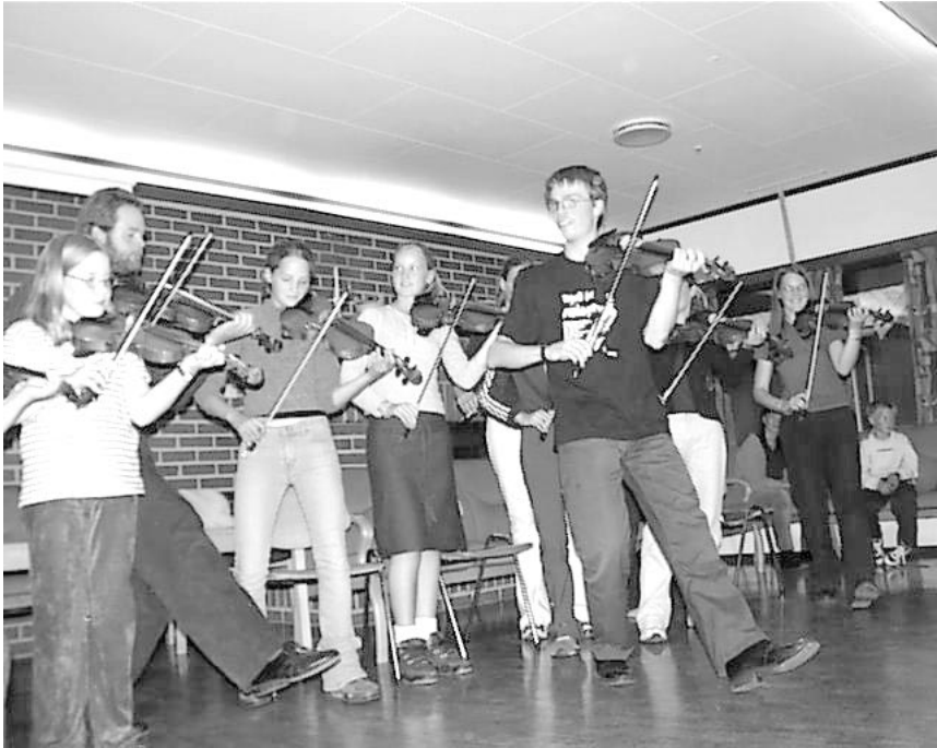
Her lærer dei å låte ó linke. Frå Strunkeveka 2001