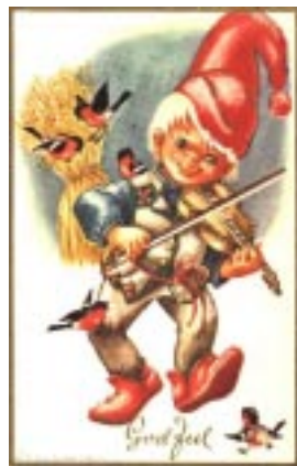
Ta fram fela i jula!