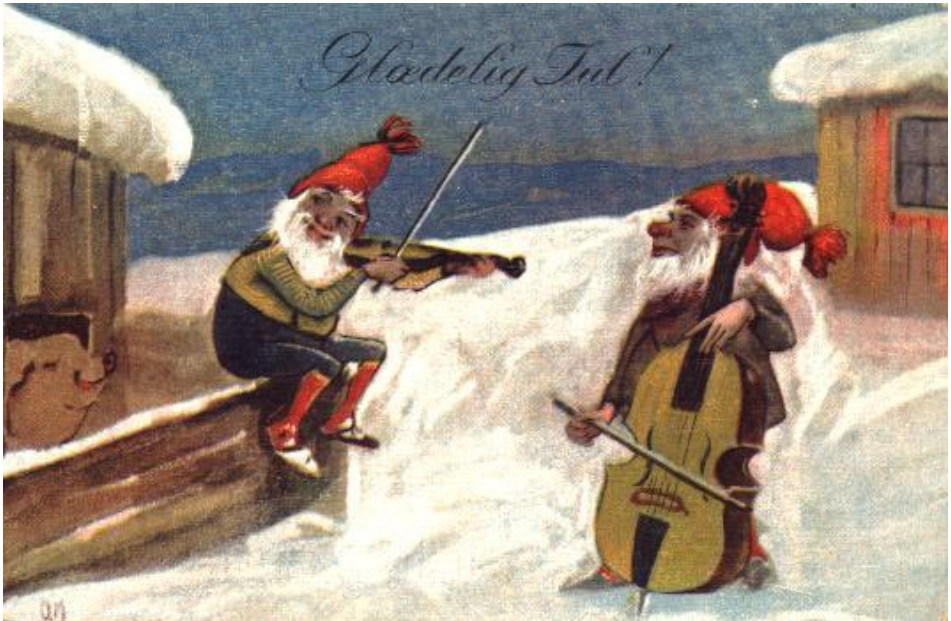
Nissar spelar hardingfele med komp!

Valdres Folkemusikklag ynskjer alle lesarar ei god jul og eit riktig godt nyttår!