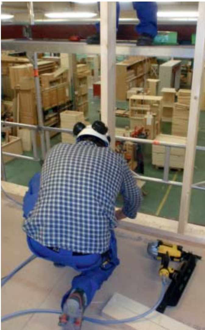
Tømrerelevne bygger tre dager i uka. De to siste dagene sitter de på skolebenken og lærer yrkesteori.