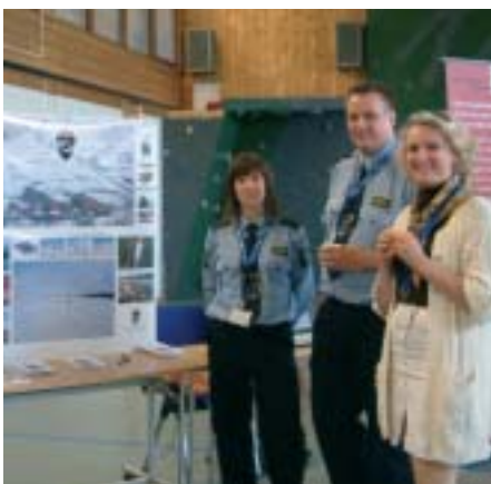
Vadsø fengsel var årets nykommer på fagcaféen