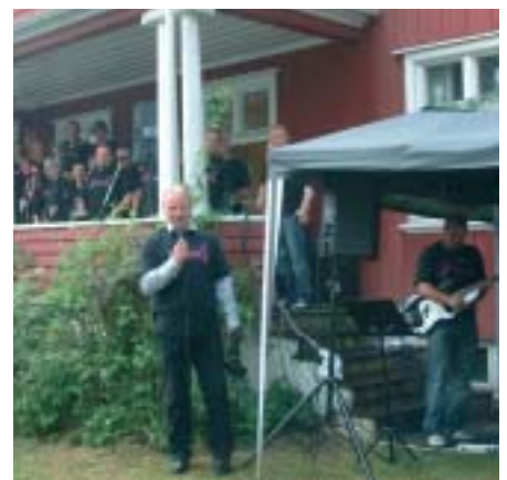
Koret fra Halden fengsel underholdt på kvelden