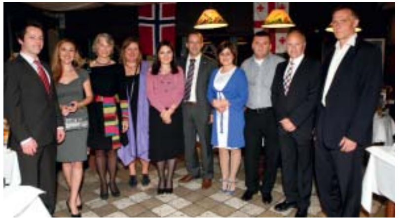
NORLAGs 5-årsjubileum oktober 2009.

The Norwegian Mission of Rule of Law Advisers to Georgia (NORLAG) har vært stasjonert i Georgia i over fem år. NORLAG består av seks norske medlemmer og fire georgiske. Arbeidet til de to fra kriminalomsorgen består i rådgivning og påvirkning av myndighetspersoner, opplæring av ansatte og å bidra til å bedre forholdene for innsatte i fengslene. Georgia sliter i dag med et raskt økende fangetall som ligger langt over gjennomsnittet i verden, overbefolkede fengsler og svært få tilbud til innsatte. Ansvarlige myndigheter ønsker å bedre innholdet i soningen, men den økonomiske situasjonen gjør at man har liten mulighet til dette.