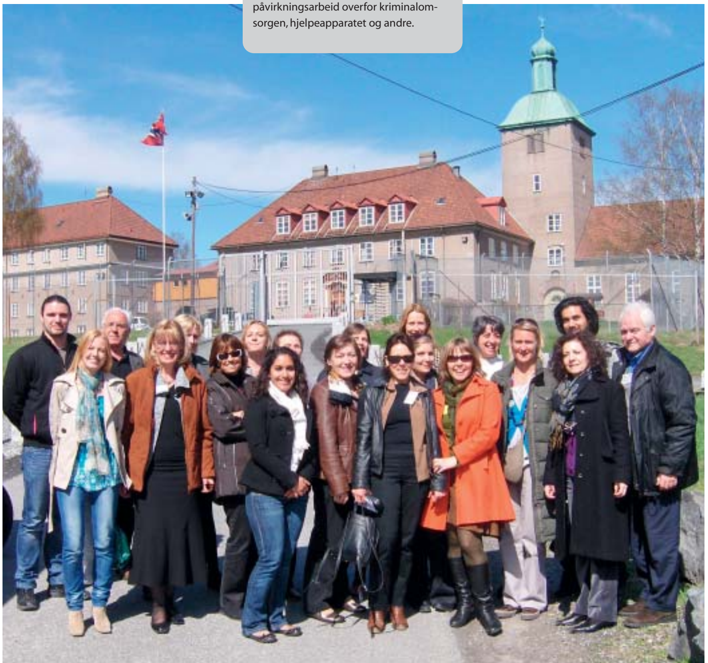
Representanter fra 12 forskjellige land besøker Bredtveit fengsel.

De tre innholdsrike dagene i Norge har bidratt til en styrking av en felles europeisk innsats for barn av innsatte, og en styrking av et viktig samarbeid blant engasjerte mennesker og organisasjoner på tvers av landegrensene. ○