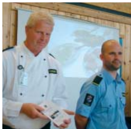
Ullersmo fengsel informerte om kokkeskolen

- Mennesker med samme diagnose kan fungere ulikt, de må forstås ut fra sin kontekst.