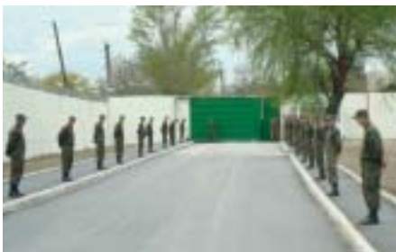
Oppstilling ved åpningen av det nye fengselet i Ksani.