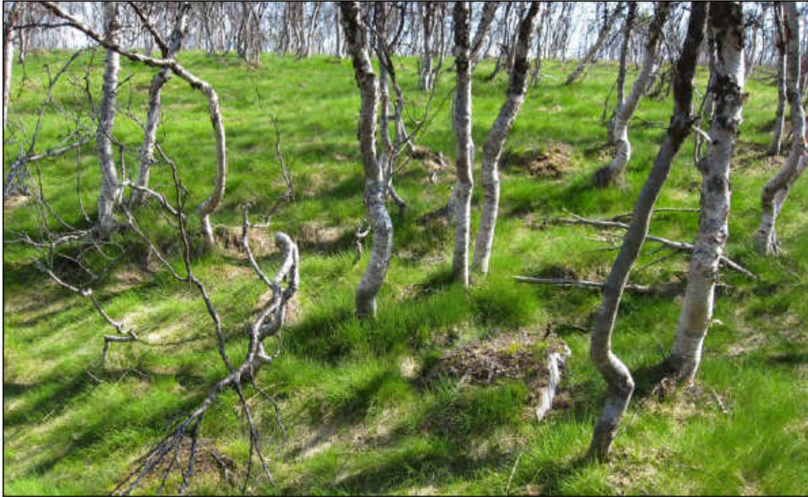
Vegetasjonen har endra seg sterkt etter flere års insektangrep. Mer og mindre sammenhengende smylematter er nå karakteristisk for blåbærbjørkeskogen i distriktet. Bildet er fra vestsida av Vuopme-Čevvelaš (MIA).