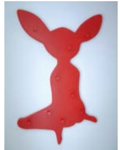
Fengselet preges av fine detaljer, her knagg i besøks huset.

Halden fengsel er et teknisk, praktisk og miljømessig moderne fengsel preget av kvalitet, men også ganske nøktern stil. Her er sikkerhetsglass i stedet for gitter foran vinduene. Fargevalget er både harmonisk og friskt. Korridorene er brede. Kunsten er utradisjonell, noe er laget i egne kunstprosjekter.