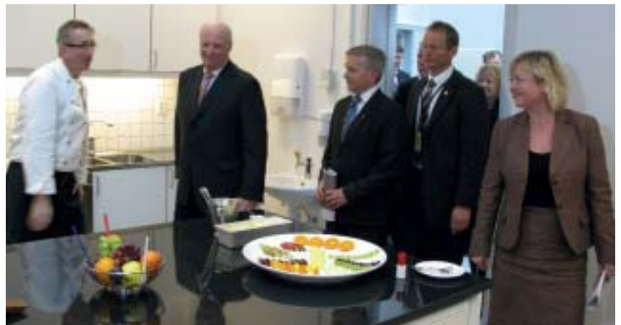
Her skal de innsatte lære matlaging.