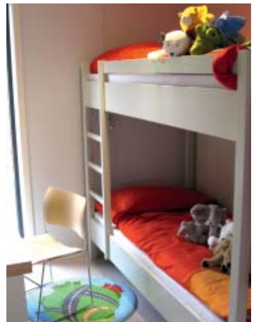
Interiør fra besøksuset.