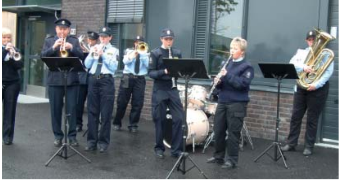
Skikkelige rytmer møtte gjestene på besøkrunden.