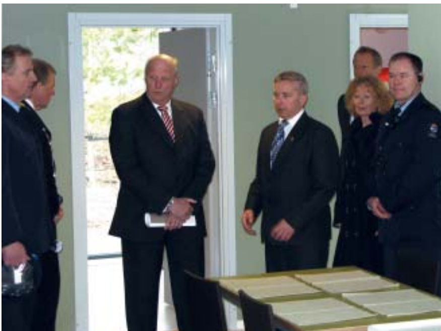
Hans majestet ble vist rundt av blant andre statsråden, fengselslederen og regiondirektøren.