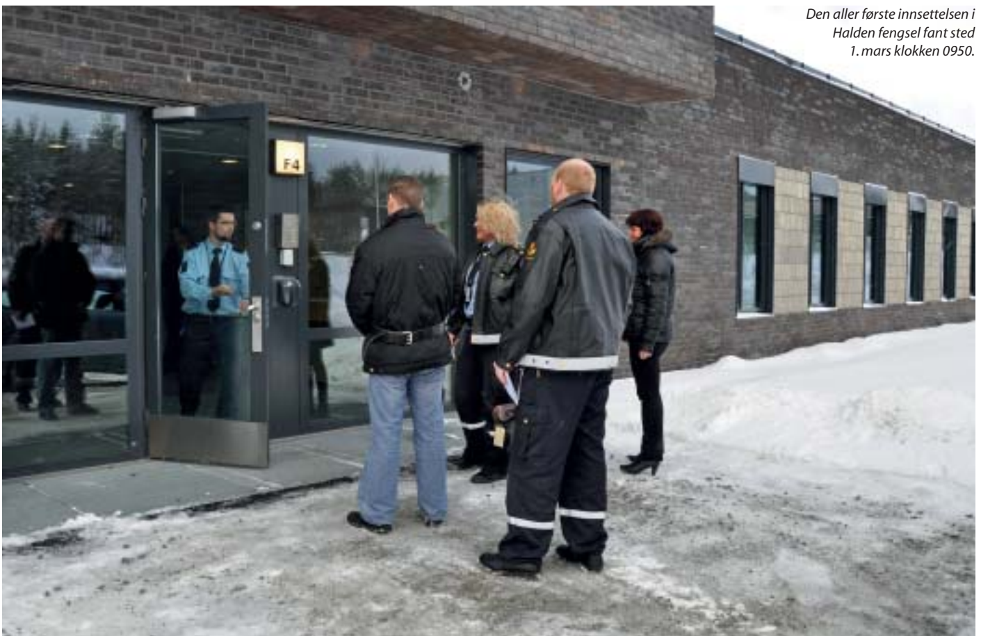
Den aller første innsettelsen i Halden fengsel fant sted 1. mars klokken 0950.