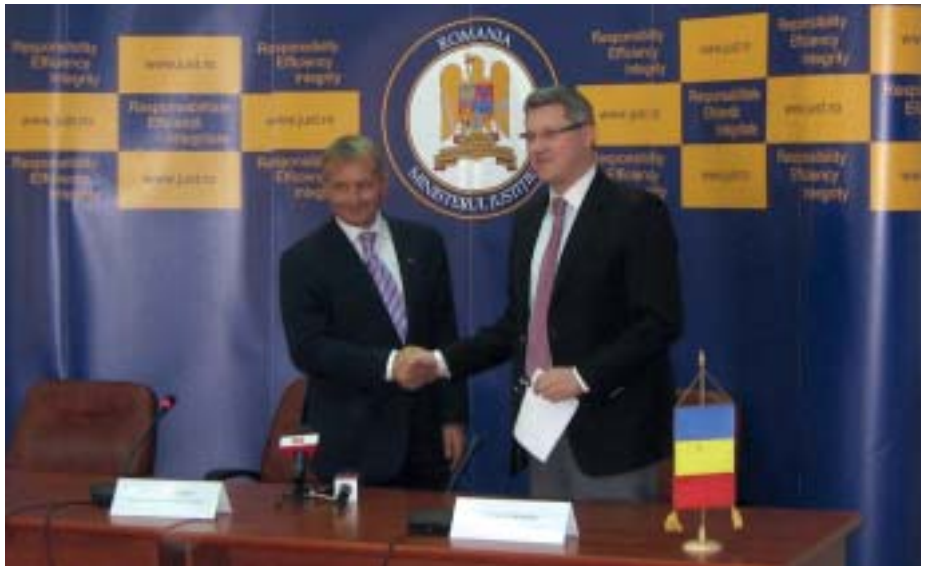
Justisminister Knut Storberget møtte i september 2009 Romanias justisminister Catalin Predolu til samtale om tettere samarbeid i justissektoren.