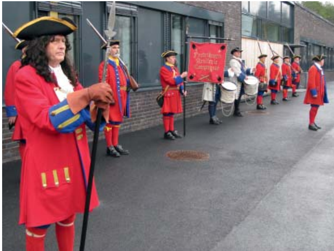
Fredriksten Artillerie Compagnie setter gjestene i feststemning der de vandrer til Aktivitetshuset hvor åpningsseremonien holdes.