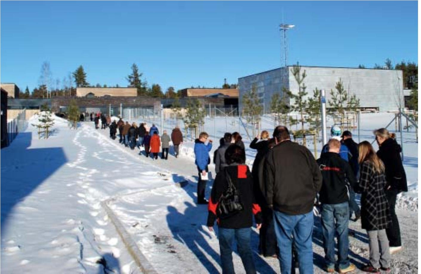
8000 besøkende kom til Åpen dag i Halden fengsel.