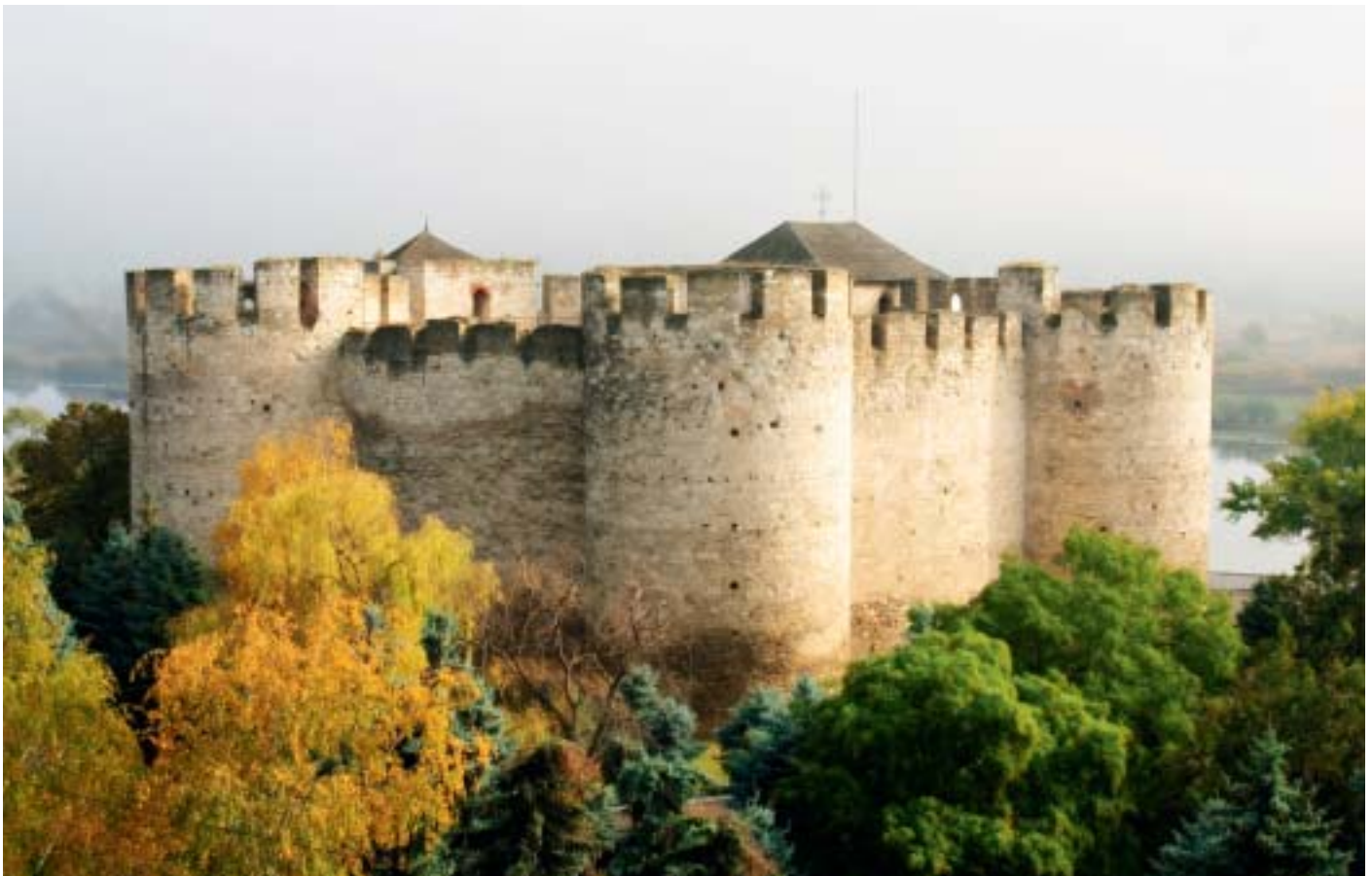
Sorocafestningen i Moldova

Norlam har vært en viktig bidragsyter til oppbygging og faglig utvikling av friomsorgen i Moldova. Etaten er akseptert som en ny og viktig aktør i straffesakskjeden. Etter tre år hvor hovedfokus har vært på oppbygging, lovarbeid, retningslinjer og opplæring av ansatte, går etaten nå inn i en ny fase hvor effektivisering og faglig utvikling blir sentrale områder. ○