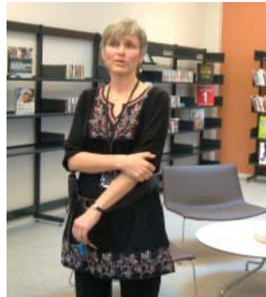
Biblioteket er åpent, det har to ansatte, flere bøker er på vei.