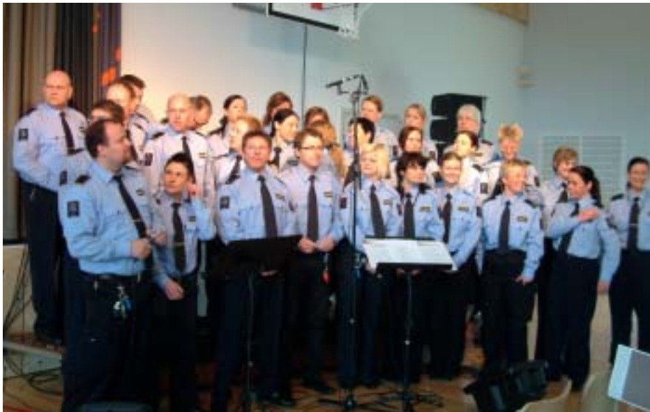
Fengende underholdning av Halden fengsels kor.