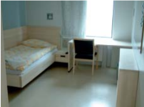
En av cellene, det er Ringerike fengsel som har laget blant annet inventar til cellene.