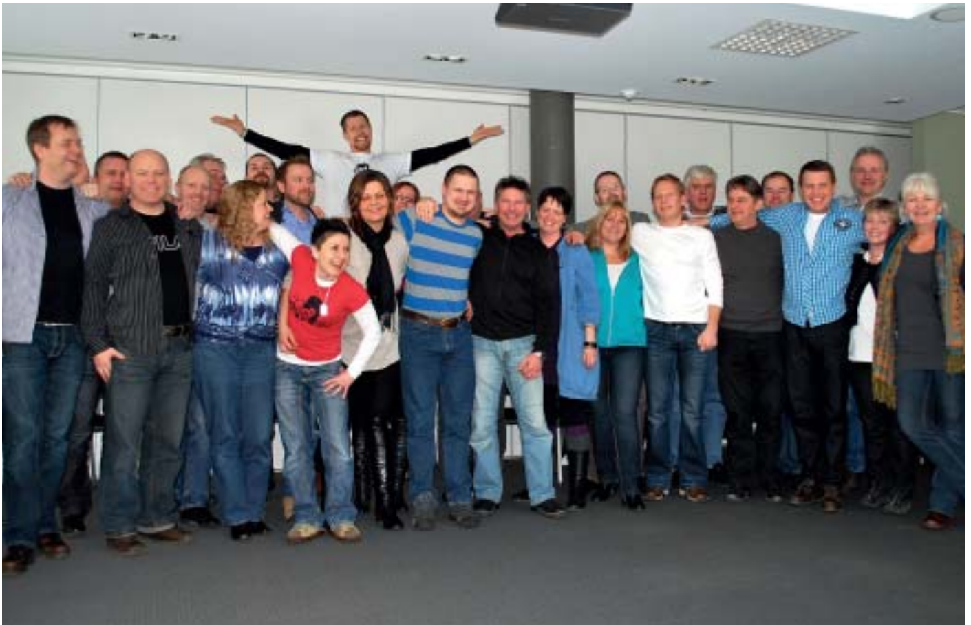
Leder-kick off to uker før oppstart.