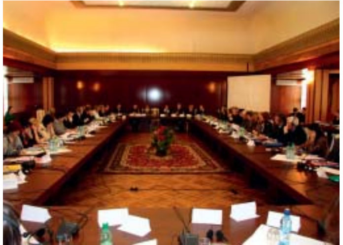
Konferansen ble holdt i storstuen i Chisinau: The Palace of the Republic.

strengt og fengselsstraffen tradisjonelt har vært det eneste straffealternativ, kan innføring av nye straffereaksjoner virke fremmed og bli møtt med skepsis blant folk flest. Derfor er det viktig at nye alternative straffereaksjoner blir akseptert og får en tillit i befolkningen. Samfunnsstraff og andre alternative reaksjoner blir til en viss grad synlige i samfunnet og har en verdi i form av at man gjør opp for seg.