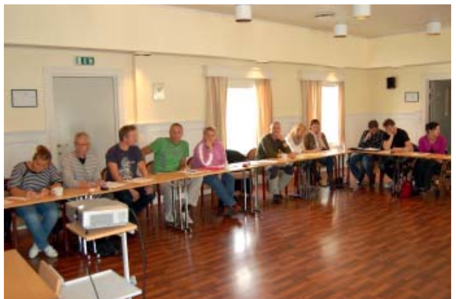
Fengselsbetjenter, politietterforskere og oppfølgere fra Trondheim kommune på kunnskapsløft-samling.

I søknaden fokuserte vi blant annet på ressursbruken til en gjenganger: En gjenganger har en oppfølgingsperson i kommunen, i tillegg til en saksbehandler på Helse-Velferd, samt en saksbehandler på NAV. I fengsel har gjengangeren en kontaktbetjent,