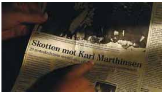
Benedicte oppdaget at bror til hennes morfar var nazist sjef i en svensk avis