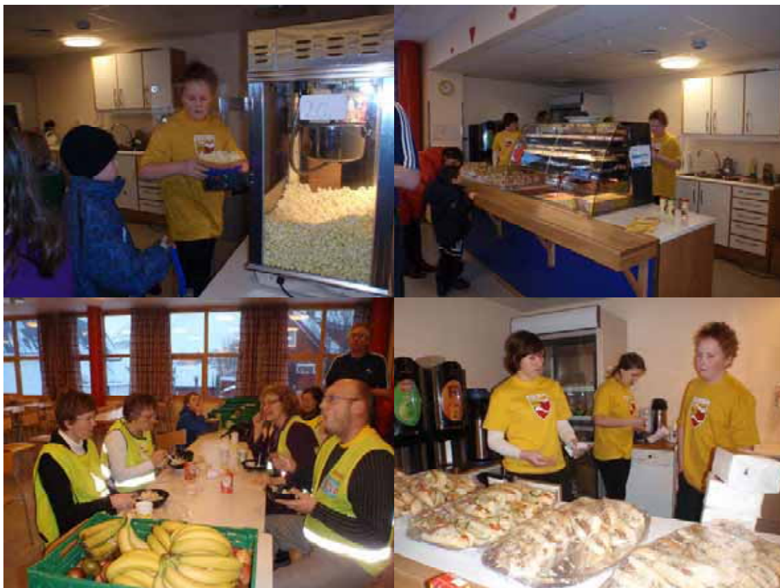
Lærerne koser seg med salat til lunch