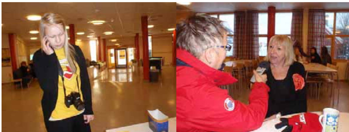
Kontakt med media er en viktig jobb....

For oss i den øverste ledelsen er dette blitt en hektisk dag. Vi håper vi klarte å ta godt vare på de to lærerne som vi hadde på stipendreise her. Tilbakemeldingen fra de er positive. Vi fikk en lærer ved Honningsvåg skole til å være kontaktperson for stipendiatene, noe som fungerte fint. Onsdagen etter Honnywood hadde vi laget et program for de med først en time på Nordkapp Maritime fagskole i båtsimulatoren de har som er Europas største på sitt område. Her fikk de kjøre store båter, simulere redningsaksjoner til havs og jobbe med oljeutslipp til havs. Etter dette hadde vi et møte med de hvor vi utvekslet våre erfaringer med satsingen på skolekino. Så bar det til Nordkapp platået med dem.