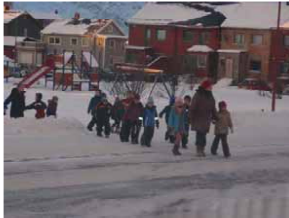
Elever på vei til/fra kino

I løpet av dagen ble det hentet ut 1441 billetter til filmvisninger. I tillegg kommer deltakelsen på alle filmkurs og verksteder. Vi er veldig fornøyd med dagen, deltakelsen og innsatsen til ungdommene. Tilbakemeldingene fra skolen og elevene er også veldig positive. Som avslutning på skolekinodagen inviterte alle gjestene og ledelsen på skolen til en felles middag.