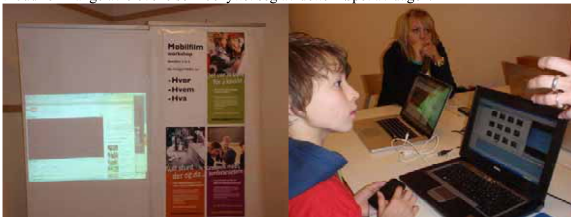
Medielinja ved Alta Videregående skole holder kurs

Alta Videregående skole ved Medielinja deltok også i år med en lærer og 3 elever hvor de rigget opp drop-in verksted i kantina hvor elevene kunne lage mobilfilm. Dette er et populært tilbud for mange av elevene som benyttet seg av dette i løpet av dagen.