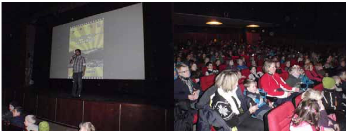
Ledelsen ved Honningsvåg skole åpner Honnywood