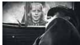
Attentatet skjedde utfør en skole. Flere skolebarn var nære vitner til det som skjedde og noen av dem forteller i filmen for første gang om det de opplevde.