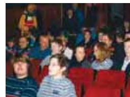
Kinosalen i Honningsvåg fylles opp av elever når filmen «Strengt Hemmelig» skal vises.

De initiativrike elevene får også hjelp av den lokale kinoen og filmfestivalen i Honningsvåg til arrangementet.