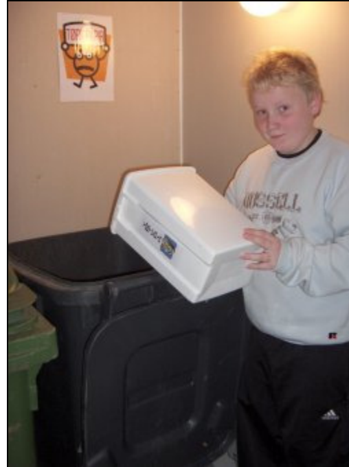
Eспен vet hvor tørt papir kastes