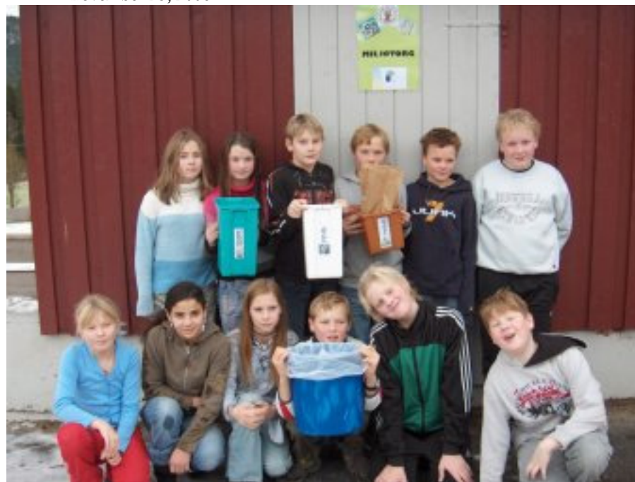
6. klasse foran Miljøtorget