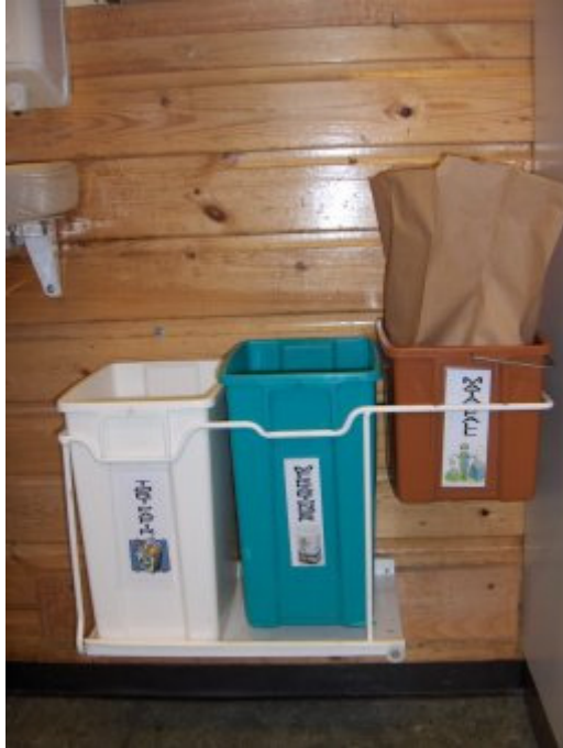
Sortering av avfall i klasserom