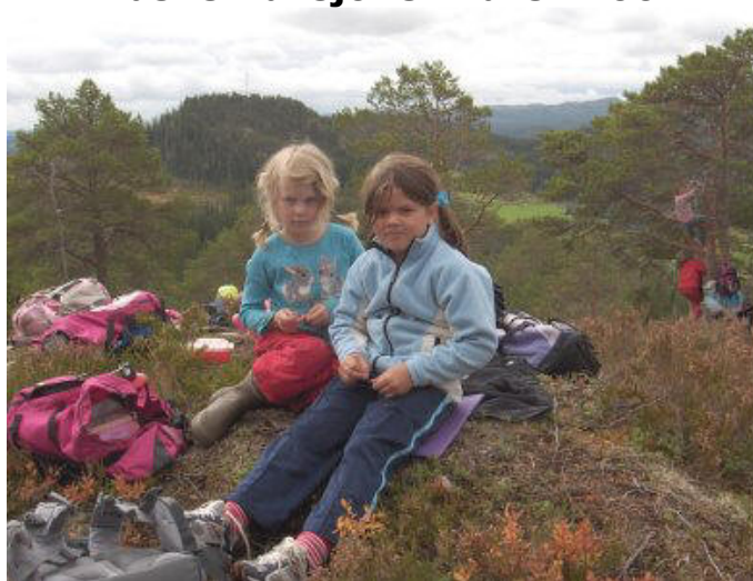
Ut på tur, aldri sur!