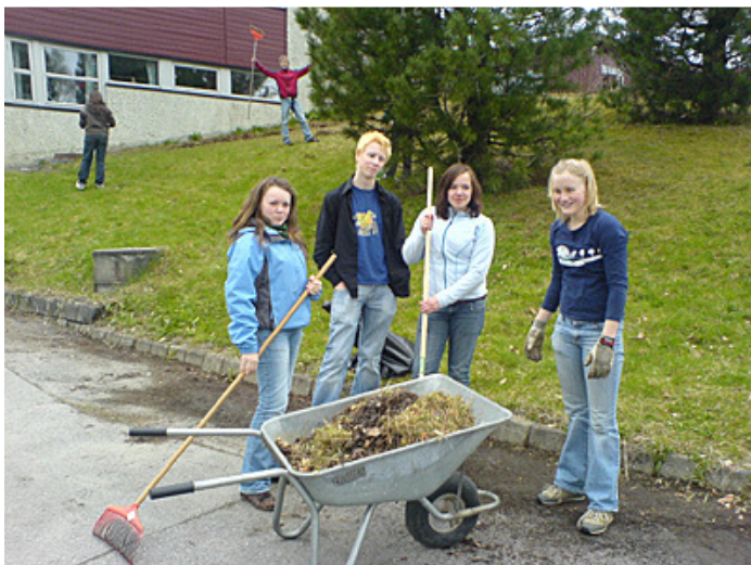
Rusken-aksjonen våren 2007