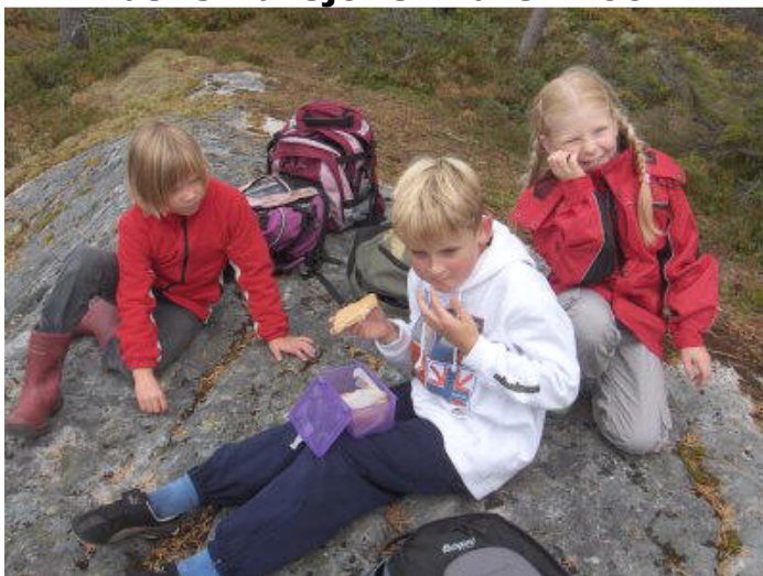
Naturen som læringsarena