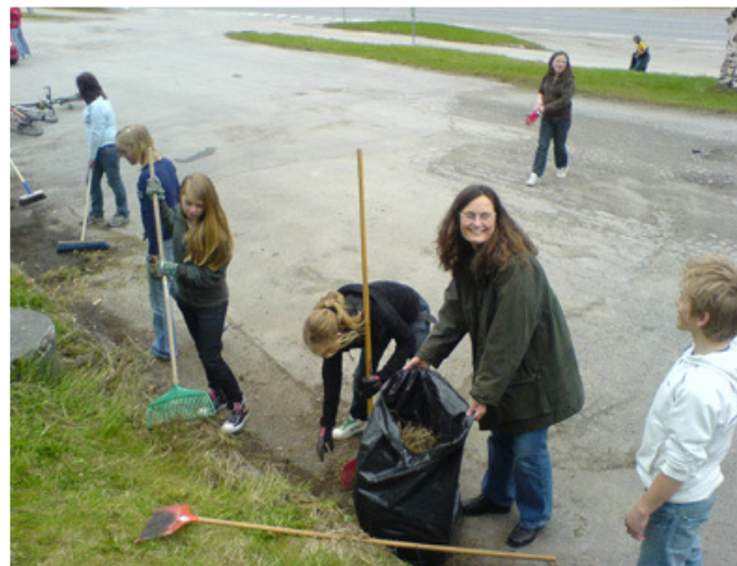
Rusken-aksjonen våren 2007