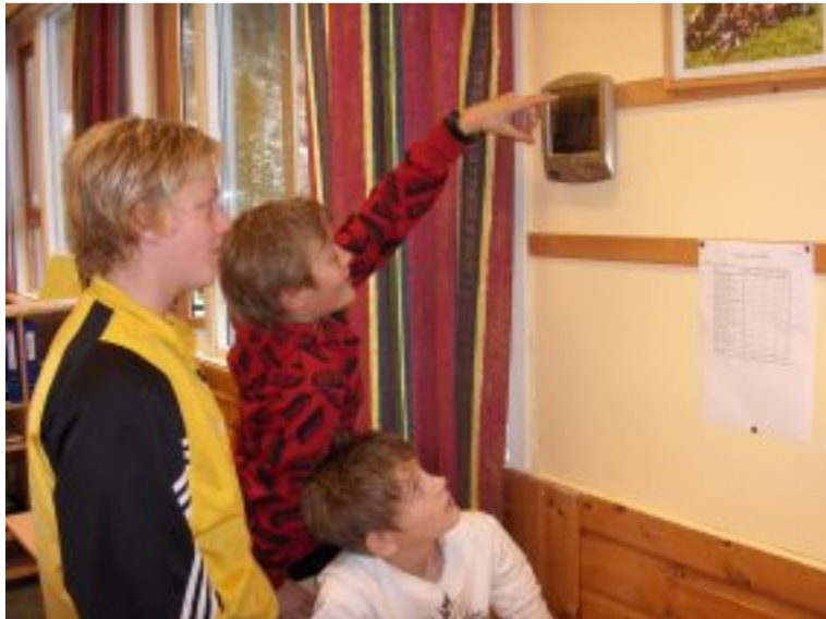
Dagens temperaturer sjekkes.